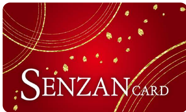
新ポイントカードデザイン

せんざんグループのカード加盟各店にてご利用いただける、電子マネー機能がついたおトクで便利なカードです。電子マネーをチャージしておけば、現金やおつりの受け渡しがないのでお支払いが簡単です！